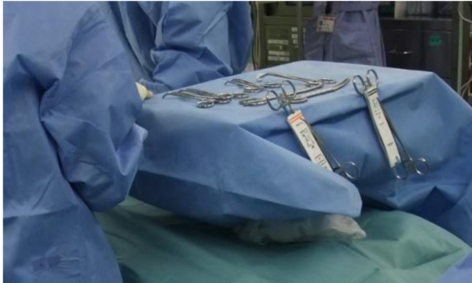
図3 臨床評価試験の様子： 情報取得用アンテナに不織布がかけられ、その上に手術器具が載せられている